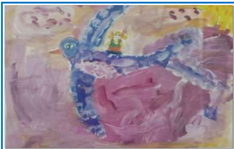
Злата Кулевацкая группа 7 «Ласточка с весной к нам летит...»